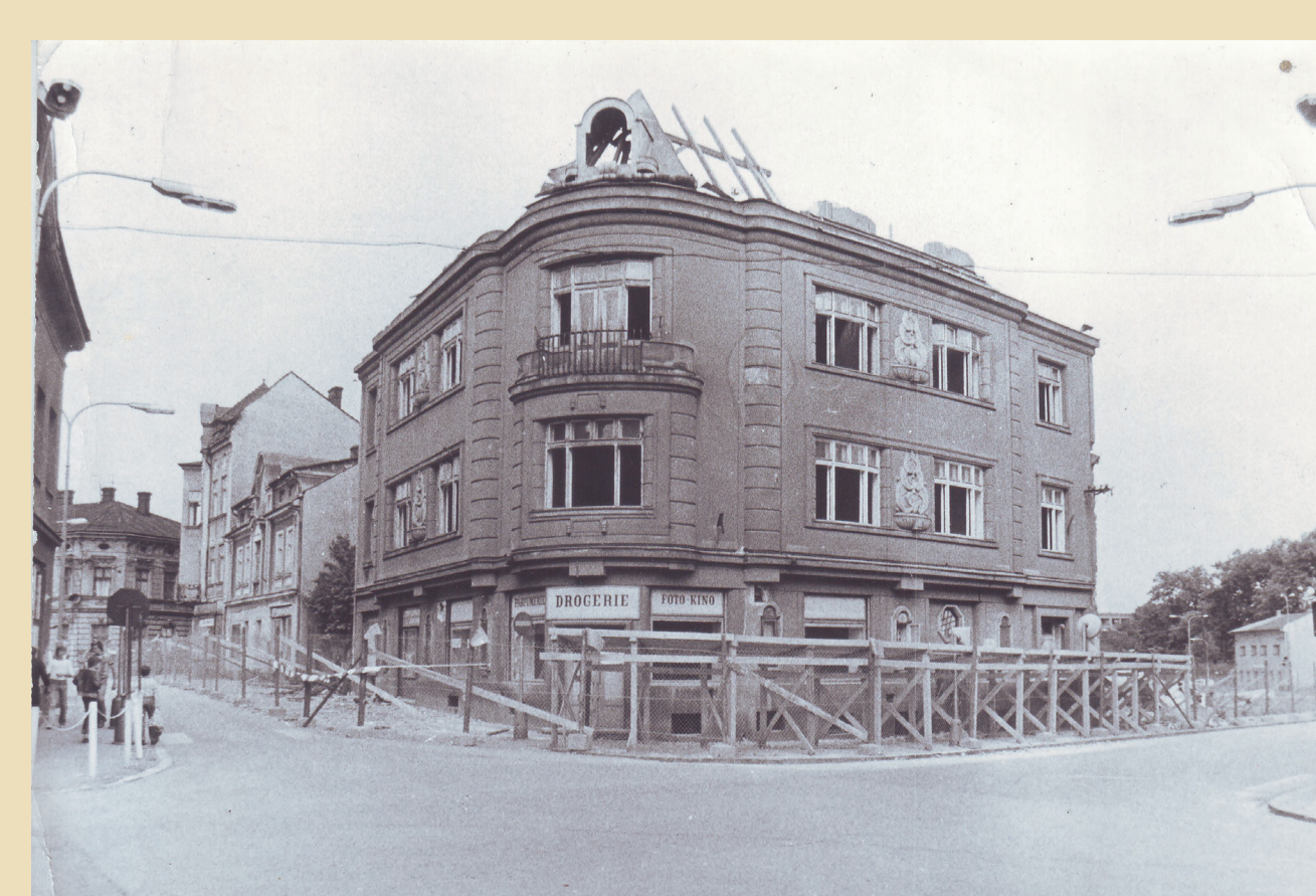
Demolice domů na rohu náměstí a Hrnčířské ulice a na rohu Fryštátské ulice a K. Šliwky v letech 1969–1973.