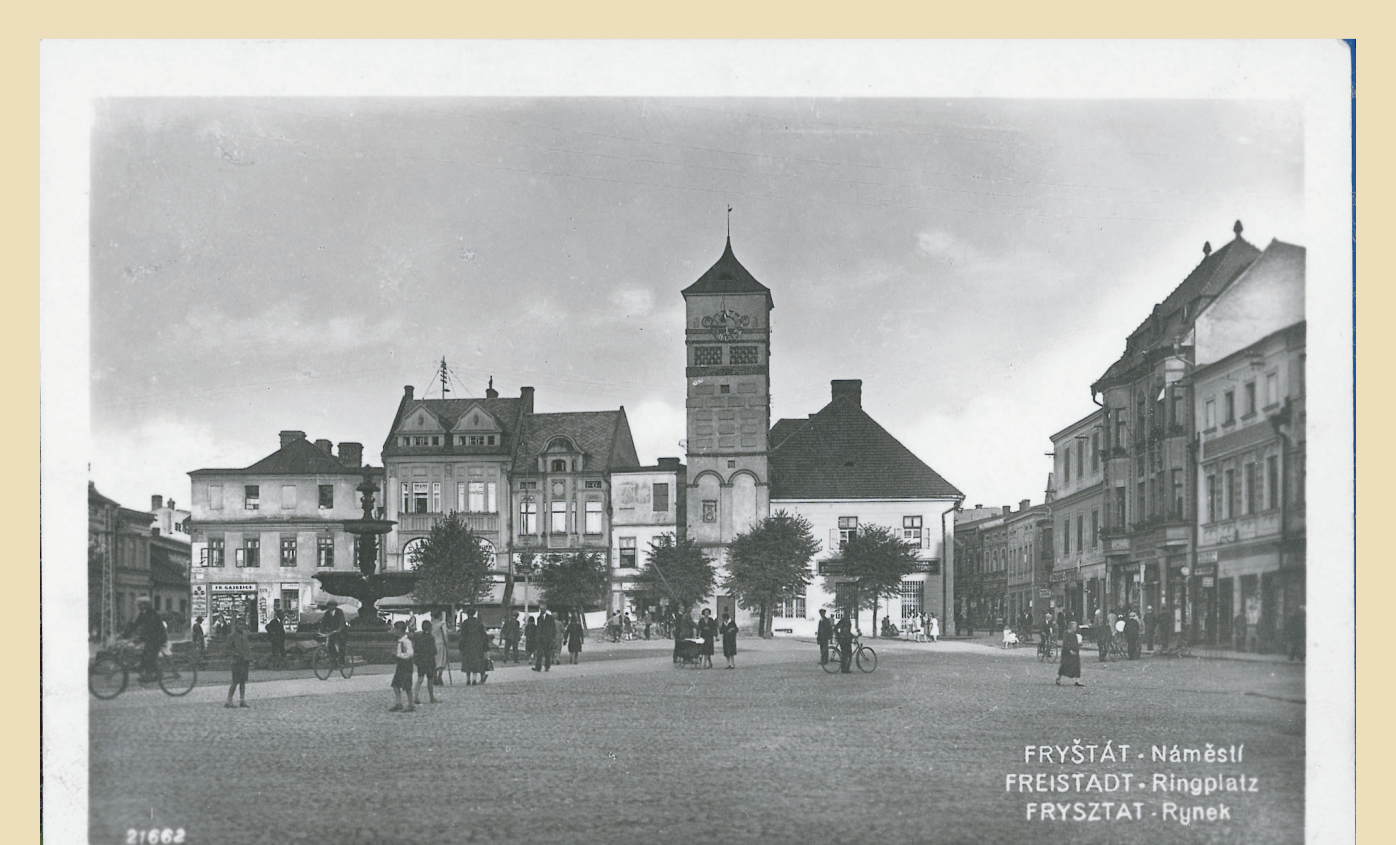
Pohledy na náměstí ve Fryštátě v první polovině 20. století.