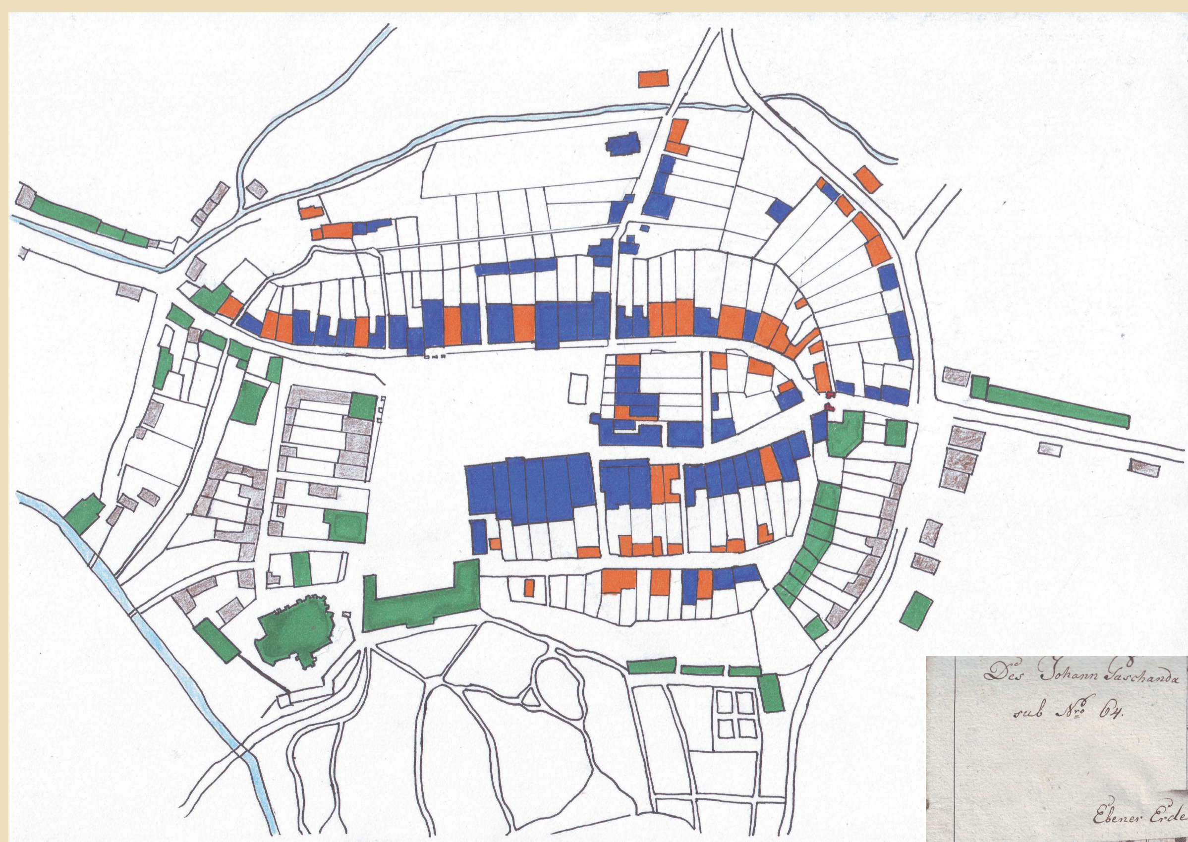
Schéma půdorysu města Fryštátu s vyznačenými nepoškozenými a poškozenými zděnými a dřevěnými domy ve městě Fryštátě po požáru v roce 1823.