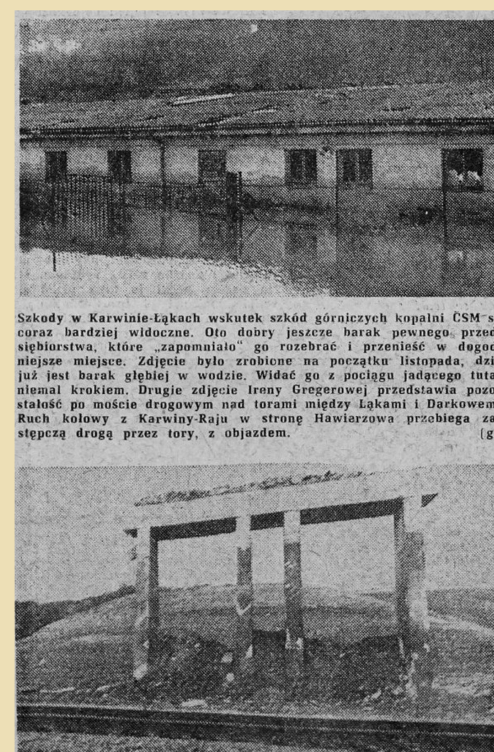
Informace o aktuálním stavu poddolování tvořily jen zloemek zpráv v místním tisku.

Z rozboru vyplývá, že bezprostředně ohrožené objekty bude