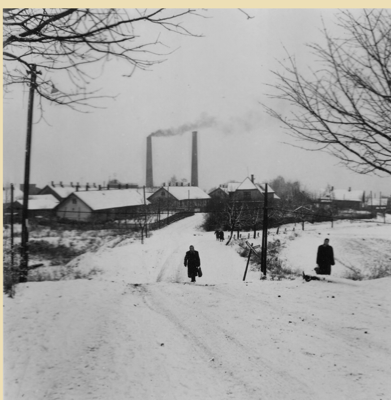
Okolí Dolu 1. máj (Barbora) v roce 1958.