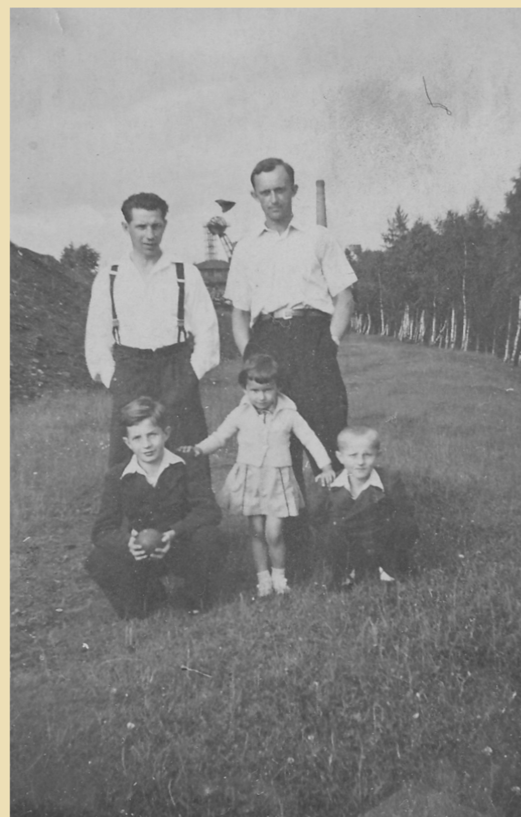
Procházka po okolí dolu Jindřich v roce 1943.

S rekonstrukcí ekonomických poměrů po listopadu 1989 souvisely změny v majetkové struktuře OKD, n. p. Vznikla akciová společnost, v níž měl do roku 1998 většinový podíl stát. Posléze byla část OKD, a.s. prodána společnosti KARBON INVEST, a.s., která do roku 2004 převzala kontrolu nad celým důlním komplexem.