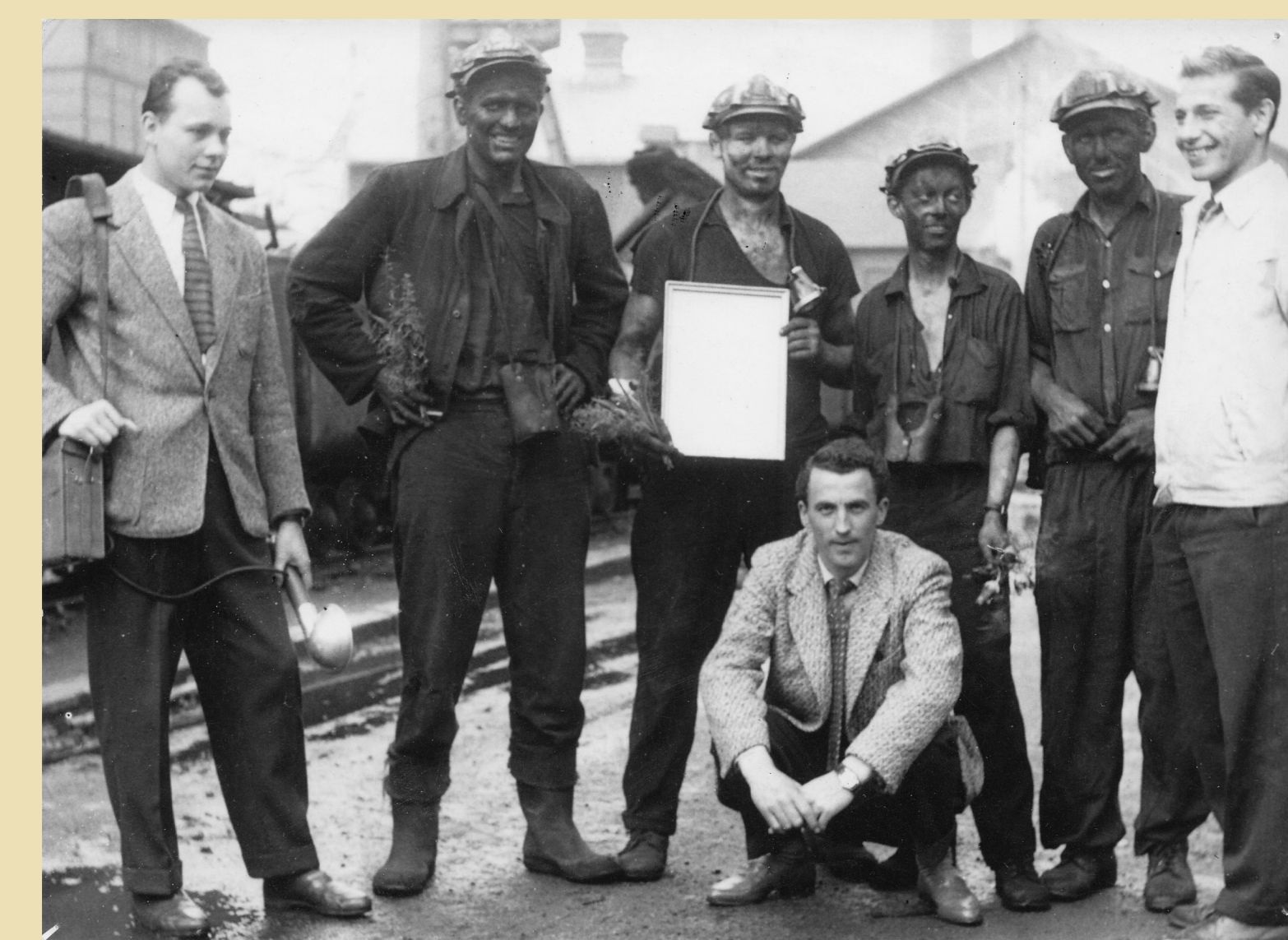
Karvinští horníci s redaktory závodního časopisu Dolu 1. máj na nedatované fotografii.