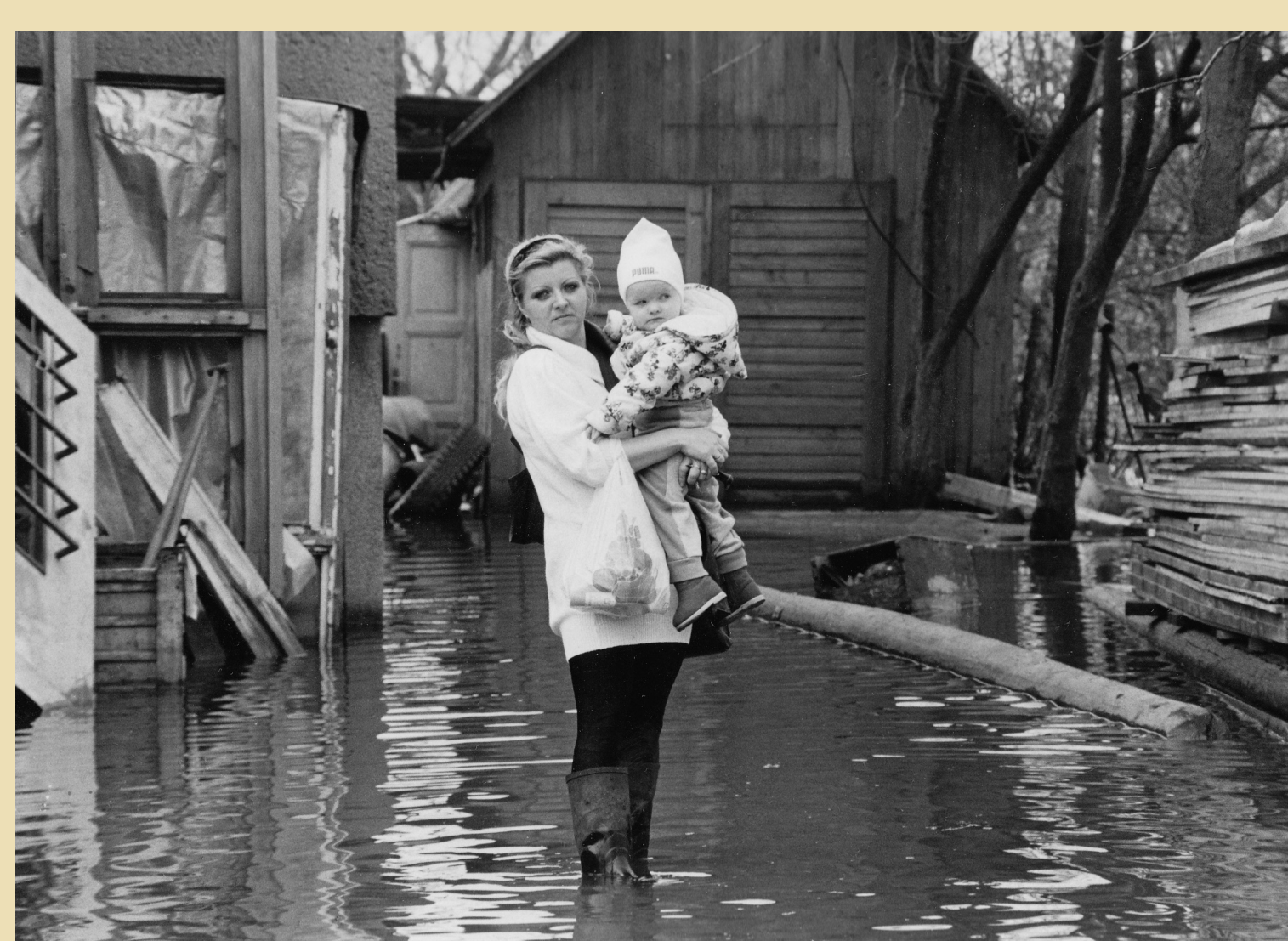
Obyvatelé Darkova v roce 1993.

V 70. a 80. letech se důlní činnost šířila také do okolních obcí Darkov a Louky. V současnosti je předmětem výkupů lokalita Starého Města.