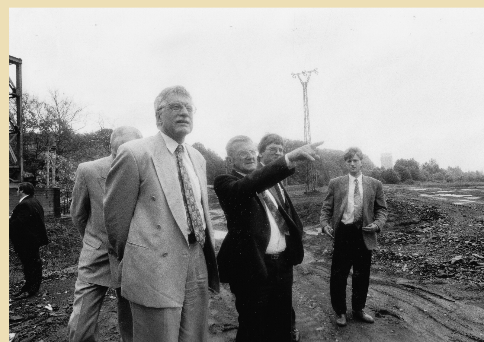
Premiér Václav Klaus v roce 1994 na prohlídce poddolovaného okolí Karviné.