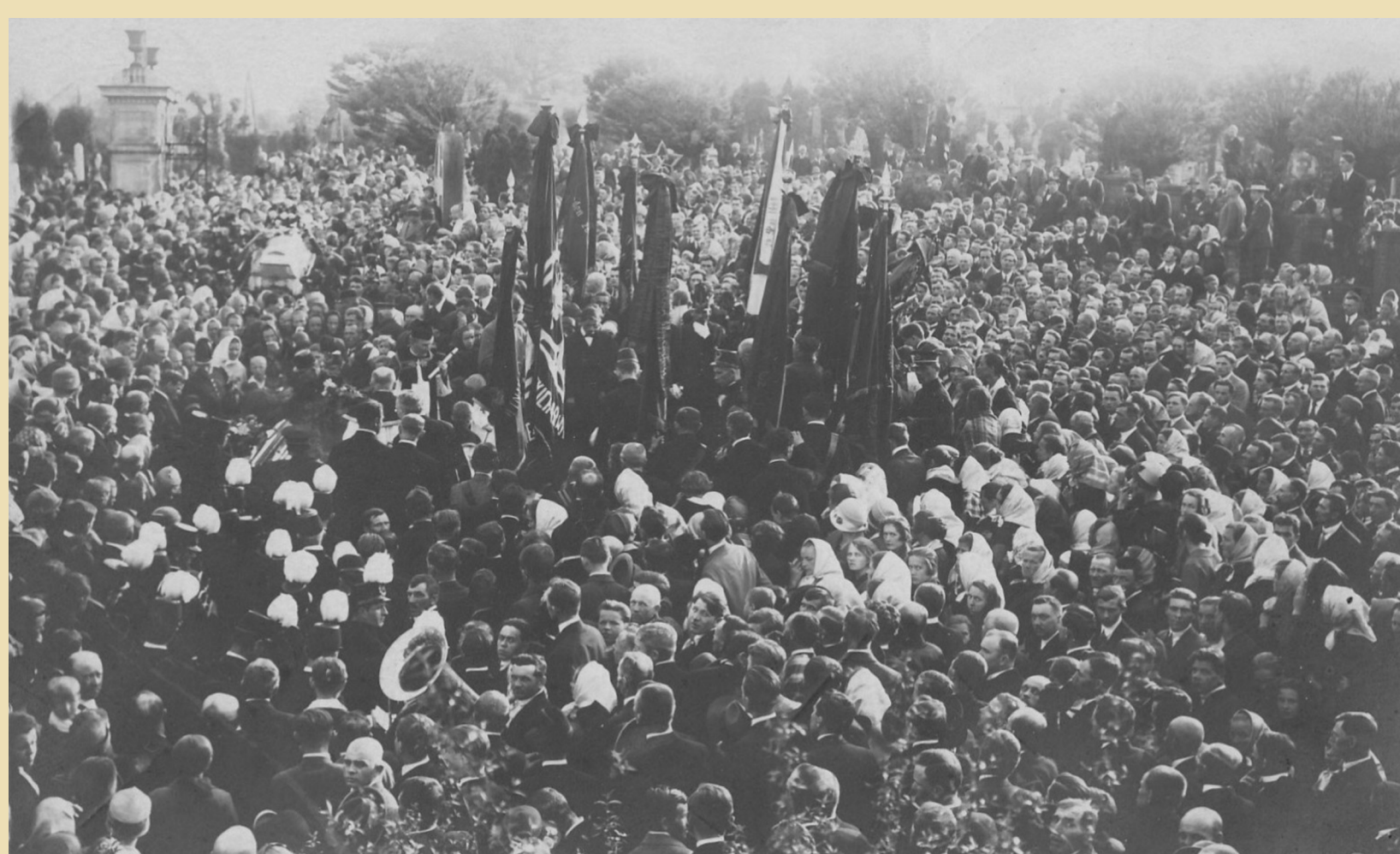
Pohřeb sedmi horníků, zesnulých následkem exploze v závodě Barbora v roce 1927.