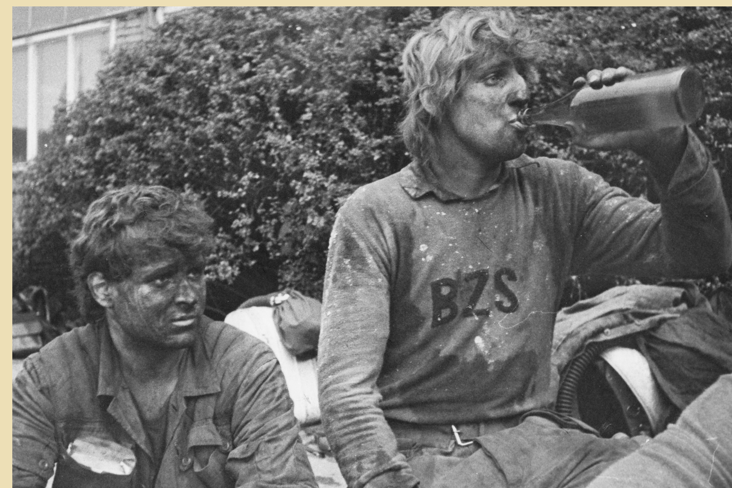
Dvě fotografie zachycující následky exploze v závodě 1. máj (Barbora), která byla největším polistopadovým důlním neštěstím. Nehoda usmrtila 30 horníků. Vlevo jsou členové báňské záchranné služby. Vpravo léčba dvou z devíti těžce zraněných zaměstnanců.