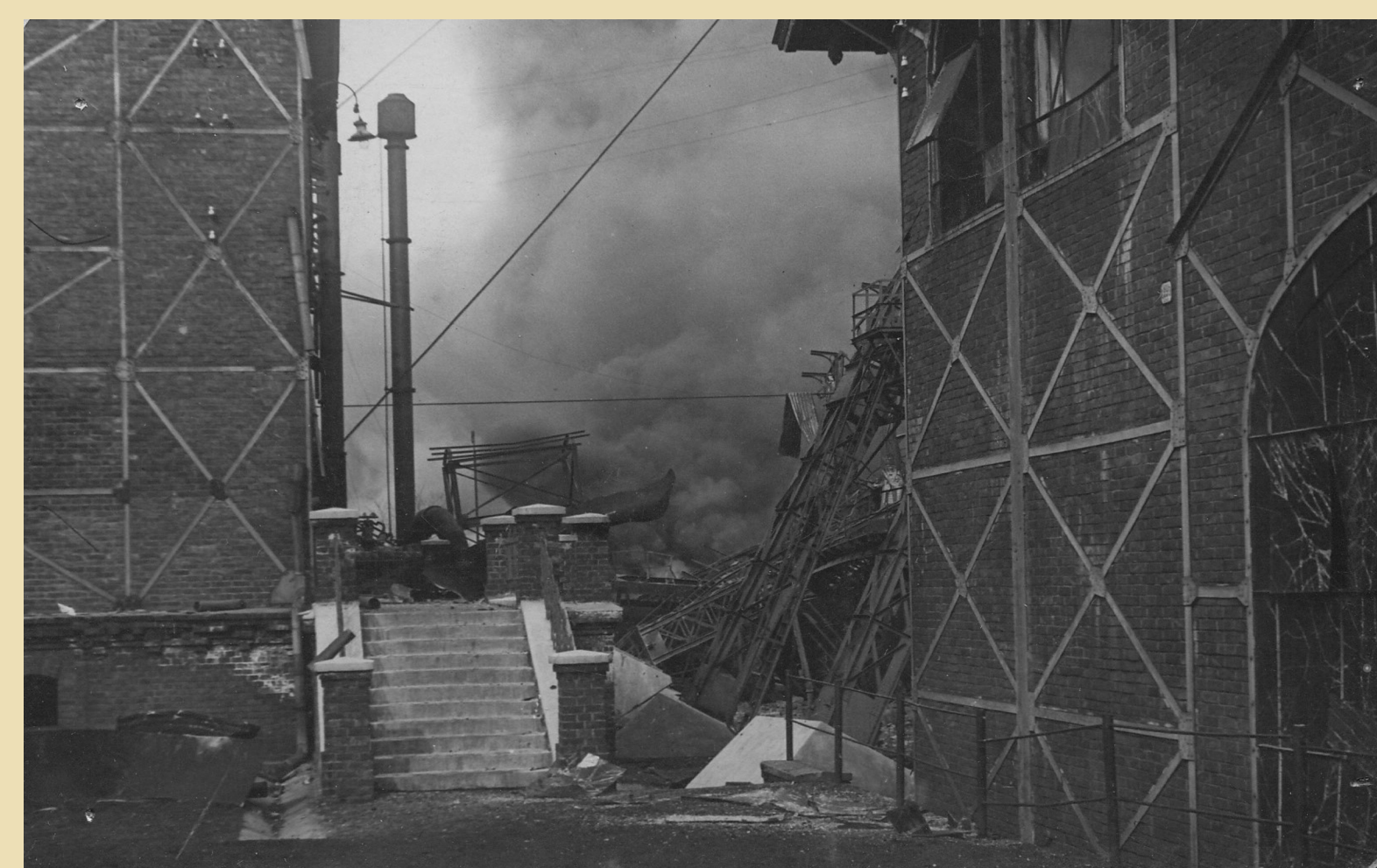
Výbuch na jámě Gabriela v roce 1924 usmrtil 15 mužů. Druhá exploze, která následovala asi dvě a půl hodiny po prvním výbuchu, rozmetala železnou věž na povrchu.