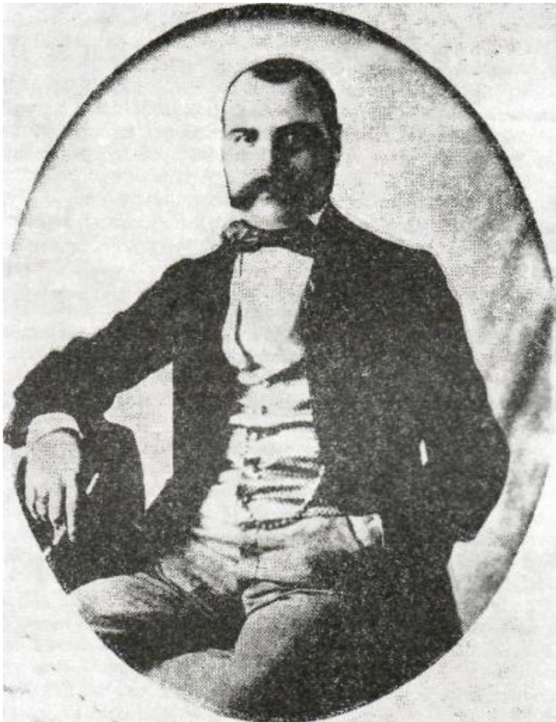
Jan Kozánek (1819—1890)

„V Přerově je tomu asi rok, co několik mladých mužů k držení časopisů a ke kupování knih československých se sřeklo. Z nepatrného začátku vyvinul se nyní čtenářský spolek 30 nebo 40 oudů počítajících, z nichžto, co právě nejpotěšitelnější jest, aspoň dvě třetiny stavu průmyslného a řemeslnického jsou. Drží Pražské noviny, Včelu, Květy, Pražského posla a Kocourkov, mimo to koluje laskavostí jednotlivců Poutník, Blahozvěst a Časopis musejní. Z dobrovolných měsíčních příspěvků na knihy koupila se už hezká hromádka československých knih, které spolu i s těmi, ježto někteří jednotlivci ze své zásoby k tomu za dar určili, činíce již nyní přes dvě stě svazků, za základ pro budoucí městskou knihovnu určeny jsou. Půjčují se nejen čtenářskému spolku, nýbrž komu se líbí, a zdá se, že už mnozí pro tento šlechetnější pokrm ducha zamilované posud hospodě a kartám se zpronevěřili, a jiní že ne jeden desetník místo šalivé loterie za knihy obětovali. Nemalou zásluhu v udržování pořádku s časopisy a knihami má pak učitel Vitásek. Dle přísloví: „Kde Slovan, tam zpěv“ vyloupl se z čtenářského spolku i malý zpěvný spolek, jenžto českými čtvero zpěvy a písněmi národními i jinými obveseluje a dobré věci prospívá. V minulém měsíci vystoupil ponejprv napolo veřejně před obecnstvem, ohledem na místo dosti četným. Ze zpěvů, buď sborem, buď čistým čtvero zpěvem, buď jednotlivým hlasem přednášených, líbily