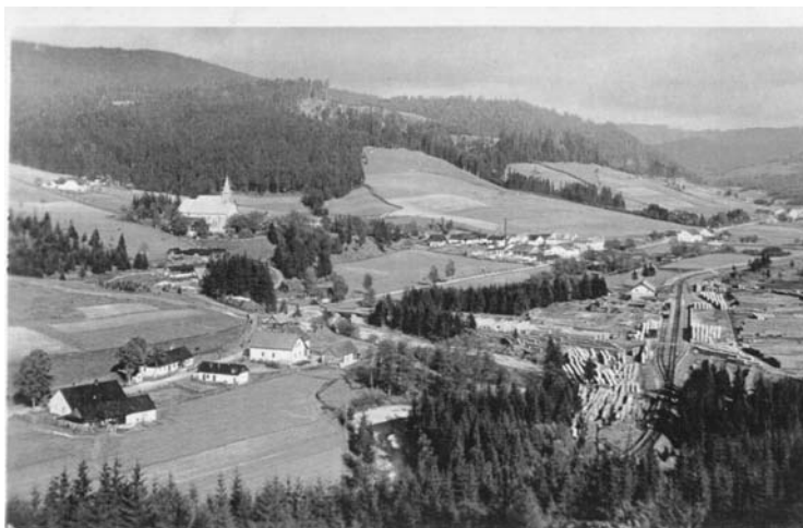
Údolí Starých Hamer, dnes zatopené