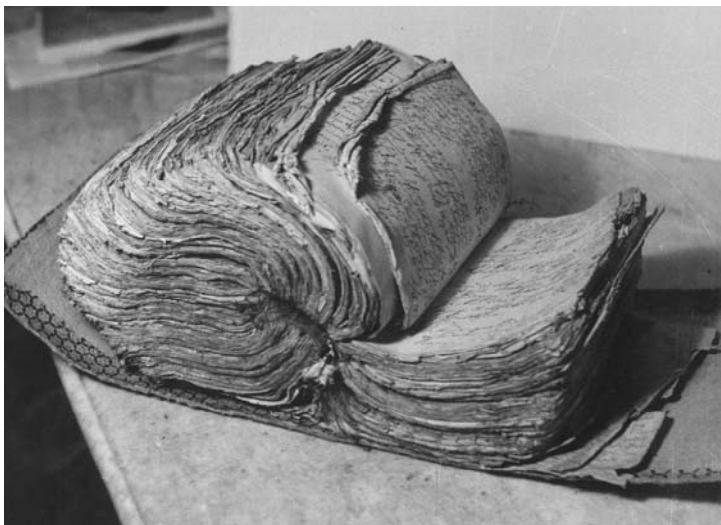
Brušperská gruntovnice před restaurováním