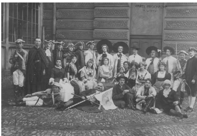
Ochotníci po představení hry Psohlavci (1918)