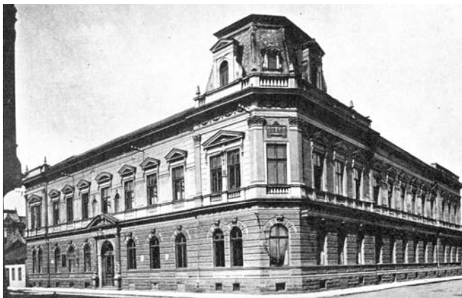
Národní dům v Místku

hospodářské školy. Od listopadu 1896 sloužil pro potřeby gymnázia přední trakt budovy nově postaveného Národního domu.