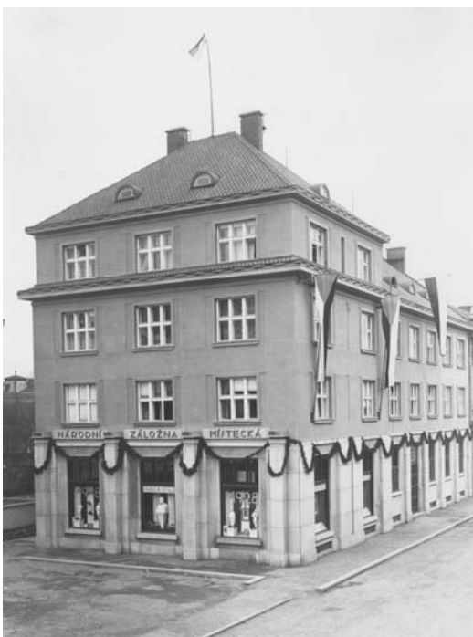
Národní záložna Místecká

Z jeho iniciativy a za jeho dohledu došlo také k postavení nové reprezentativní budovy Národní záložny Místecké. Až do poloviny 20. let totiž neměla potřebné prostory, ve kterých by mohla spravovat narůstající agendu. V letech 1893 až 1922 se dokonce úřadovalo u Procházků doma. Se stavbou nové budovy bylo započato 13. června 1927 a 1. září 1928 se do ní začali stěhovat první nájemníci. Koncem roku se zde začalo úřadovat.