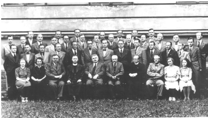
Profesorský sbor roku 1940