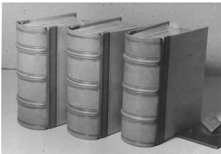
...a po zrestaurování