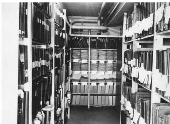
Část archivního depozitáře v suterénu kina P. Bezruč

o archiválií“, při intenzivnějším kapání musely být vyprazdňovány i o víkendech a někdy i v noci. V roce 1985 došlo k největší havárii, kdy během víkendu prasklo teplovodní potrubí, z něhož horká voda pod tlakem stříkala do vzdálenosti několika metrů. Přímo zasažené archiválie se musely zlikvidovat, ostatní se doslova uvařily v páře. Usušit cca 3000 bm archiválií je nemožné, depozitáře nešly větrat, suterén měl jen sklepní okýnka pod úrovní chodníku. Plísně napadly skoro všechno, byly zbarvené do černa, zelena i fialova, při vytrhávání linolea se prášilo do šeda.