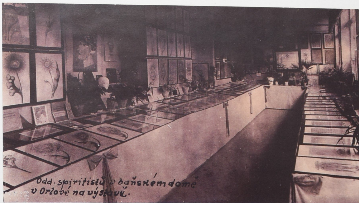
Duchovní život obyvatel Orlové se neomezoval jen na oficiální církve, ale působili zde adventisté či spiritisté, jak dokládá výstava prací spiritistů.