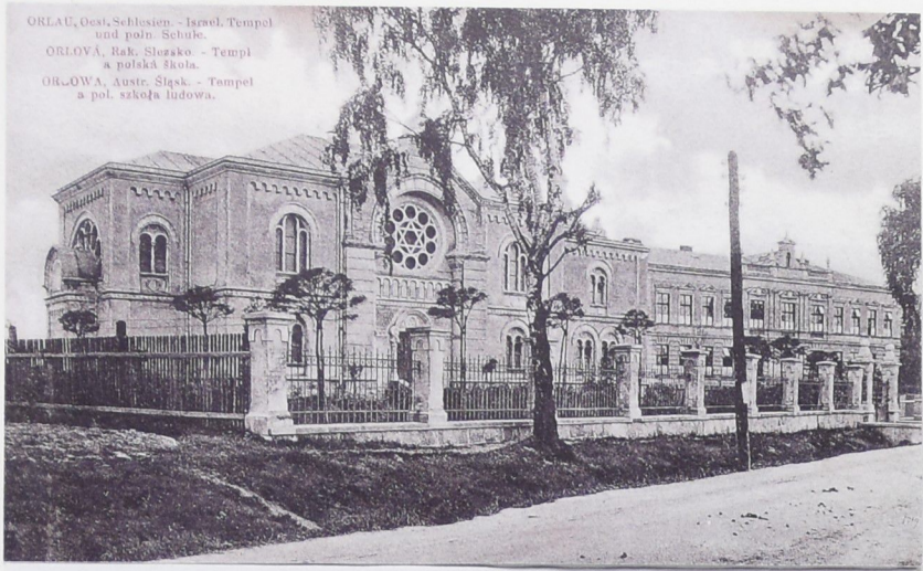
Budova orlovské synagogy se nacházela u okresní silnice mezi budovou sokolovny a polské školy. Ve třicátých letech 20. století si nechali postavit ortodoxní židé budovu vlastní modlitebny.